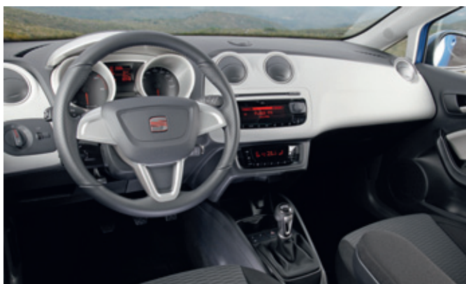
Der Laderaum des Seat Ibiza ST Kombi hat eine breite Öffnung und fasst zwischen 430 und 1.164 Liter. Der sportliche Charakter zeigt sich auch im Innenraum. Die verwendeten Materialien sind hochwertig, alle Elemente sind übersichtlich angeordnet.